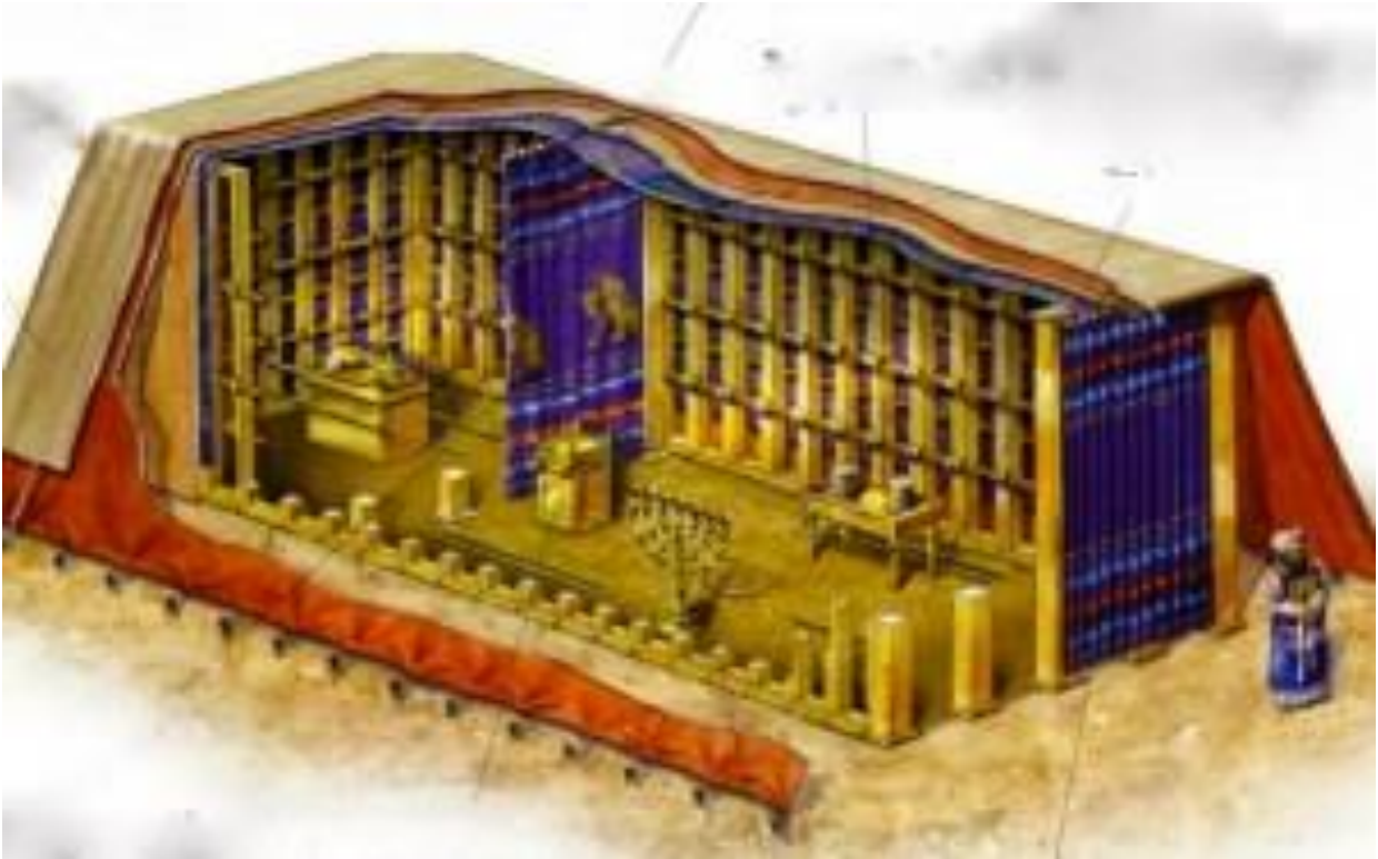
THE TABERNACLE OF MOSES (EXODUS 35-40)