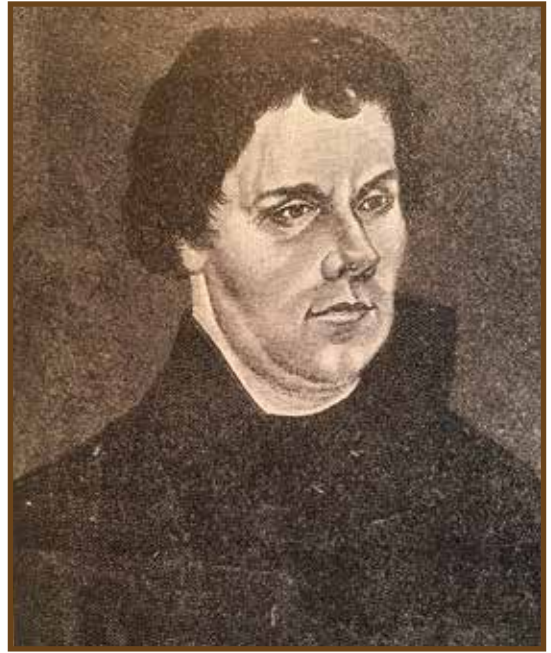
Lutherin aikalaisen Lucas Granchin maalaus

Oletko murehtinut heikkoa uskoasi? Olet saanut ehkä neuvoja: rukoile hartaammin, antaudu kokosydämisesti ja niin edelleen. Sukutaustani on helluntailaisuudessa, jossa ihmisen henkilökohtaisen uskonratkaisun merkitystä on korostettu voimakkaasti. Lapsena ja nuorena rukoilin useita kertoja niin sanotun syntisen rukouksen, jonka tosissaan luettuaan ihmisen katsotaan tulevan uskoon. Mitään uskoontulotodistuksista tuttua rauhan ja vapauden tunnetta ei tullut. Yritin vakuutella itselleni olevani nyt uskossa ja elää sen mukaan. Huomasin, että en pysty elämään niin kuin ”kunnon uskova”. Rukoilin siis yhä uudestaan ja yritin saada itseni uskomaan olevani uskossa. En onnistunut, eikä minusta koskaan helluntailaista tullut.