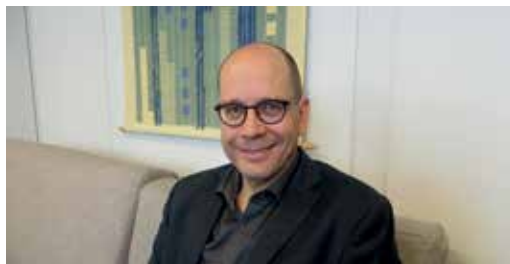
HAASTATTELU JA KUVA: JARI RANKINEN

- En tiedä, kysynkö Jumalalta taivaassa, miksi. Ehkä se ei ole siellä enää tärkeä asia.