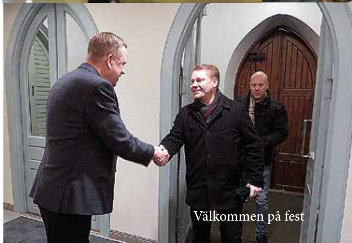
Välkommen på fest