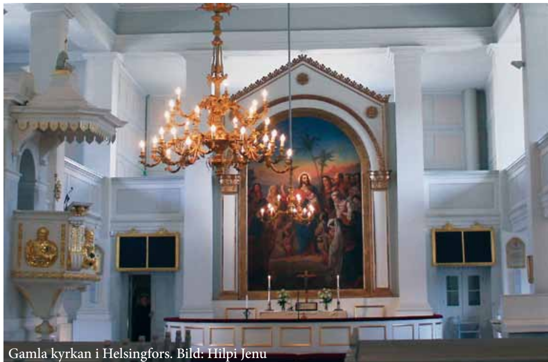
Gamla kyrkan i Helsingfors.

kommit för hela den fallna mänsklighets skull. Hans försoningsverk gäller var och en. Evangeliet befriar alltså människan fullständigt. Det renar och förnyar.