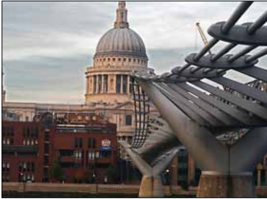
St. Pauls katedral i London