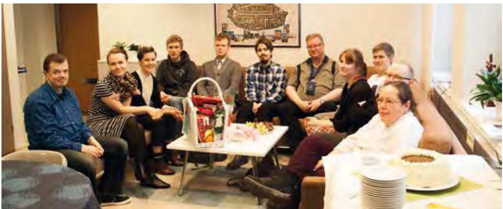
Opiskelijoita ja juhlaväkeä STI:n taukotilassa

”Minä luotan sinun armoosi, saan iloita sinun avustasi. Minä laulan kiitosta Herralle, hän pitää minusta huolen.” (Ps. 13:6)