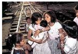
Children of Mexico City

Latinalaisessa Amerikassa ja Karibian alueella 75 % ihmisistä asuu jo kaupungeissa. Samoin Euroopassa, Australiassa, Pohjois-Amerikassa ja Uudessa-Seelannissa. Kehitysmaissa määrä on tällä hetkellä noin 37–38 %.