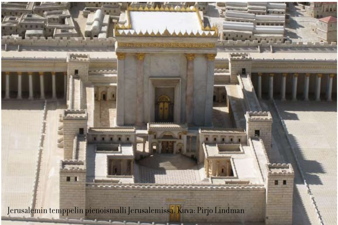
Jerusalemien temppelin pienoismalli Jerusalemissa.

Temppeliveron perusteella juutalaiset perheet osallistuiivat päivittäisen tamid-uhrin toimittamiseen. Tähän päivittäiseen uhriin kuuluivat polttouhrina teurastettu lammas sekä siihen liittyvät ruoka- ja juomauhrit (2. Moos. 29). Tamid-uhri tuotti sovituksen synneistä, ja siksi siihen osallistuminen merkitsi kaikille juutalaisille uskonnon keskeisintä ydintä, Jumalan armoa. Kun Jeesus on katkaissut temppeliveron keräämisen ja estänyt uhrieläinten myynnin, hän on noussut ankaralla tavalla temppelin uhritoimitusta vastaan. Juutalaisille tämän on täytynyt olla hämmentävää, koska he olettivat omalla toiminnallaan toteuttavan juuri sitä, mitä Jumalan on Toorassa käsenyt.