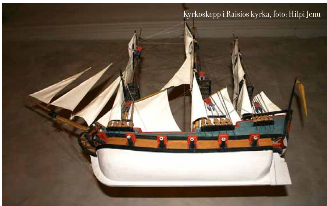
Kyrkoskepp i Raisios kyrka