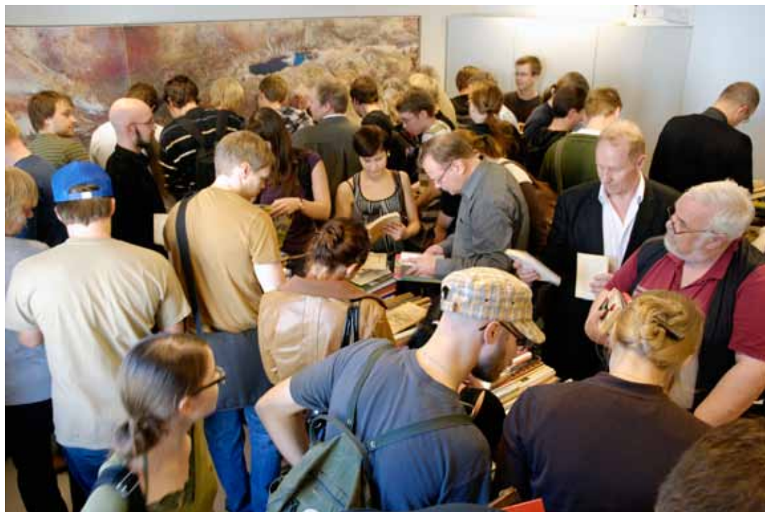
Inte ens lägonkonjunktoren får studerande att avstå från böcker. Till STI:s höst hör oskiljaktligt ett bokloppstorg. Där finner många något för en teologs viktigaste assistent, en god bokhylla.