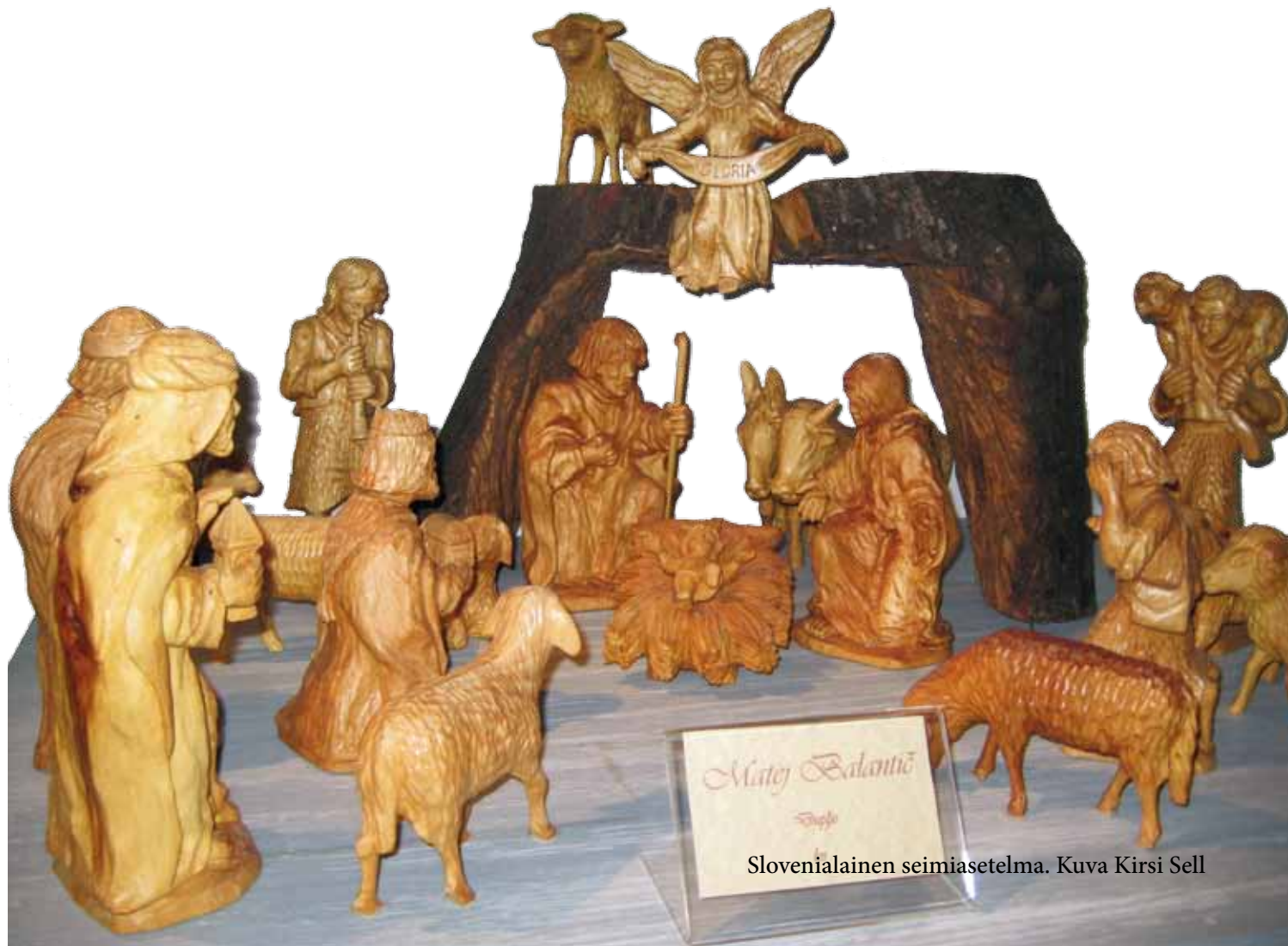
Slovenialainen seimiasetelma.