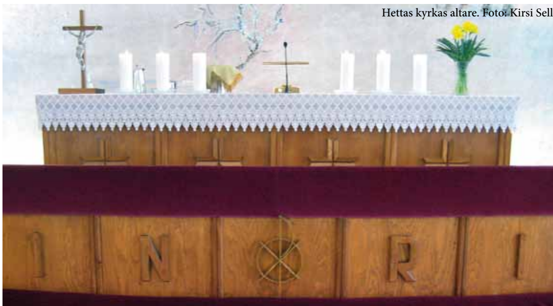
Hettas kyrkas altare.

Lyckligtvis lever vi i dag i en annan situation. Trots påståenden från påtryckningsgrupperna har vår kyrka inte ännu fattat beslut som skulle göra utlevd homosexualitet moraliskt accepterad. Kyrkan har inte heller ändrat sin uppfattning om äktenskapet som ett offentligt förbund mellan en kvinna och en man. I Finland har avgörande beslut i kyrkomötet inte fattats – inte ännu.