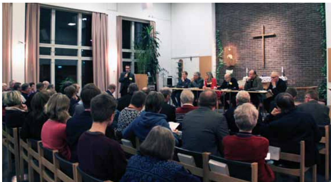
Teologdagarnas panel dryftade bl.a. väckelserörelsernas styrka och svagheter. Många talare var mycket ärliga i sin bedömning av sina egna rörelserns brister. I panelen behandlade man också kyrkans framtid och sökte en uppbyggande roll för dem i förnyelsen av kyrkan.

Man kan inte befalla väckelsen. Vi vet väl att Gud handlar när och hur Han vill. Vi föraktar dock inte den teologiska utbildningens betydelse i denna helhet. Det är som Luther sade, att vi skall be som om vårt eget arbete inte hjälpte alls, och så arbeta som om allt berodde på oss. Kyrkans och väckelsens framtid hänger i sista hand på evangeliet.