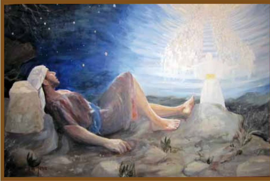
Maalaus hotelli Gilgalista Tel Avivista. Kuva: Aija Aurén

Raamatun ”historiallis-kriittisestä” tutkimuksesta on puhuttu ja kiistelty vuosikymmeniä. Joidenkin mielestä tämä tutkimuksen suunta on ainoa tieteellinen tapa tutkia Raamatun tekstejä. Toisten mukaan taas kyseinen tutkimus hajottaa Raamatun ja menettää kristillisen uskon sisällön. Nykyään kuitenkin monet alan pitkän linjan ammattilaiset puhuvat historiallis-kriittisen menetelmän kuolemasta. Mitä historiallisella tutkimuksella tarkoitetaan?