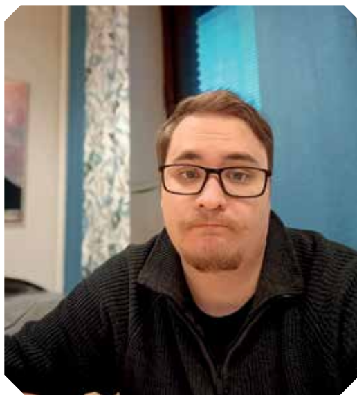
(WWW.DEEPL.COM/TRANSLATOR OCH CHRISTIAN PERRET)

TEXT OCH FOTO: PERTTU NIEMINEN, TEOLOGI STUDERANDE