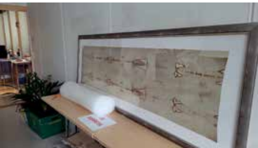
Käärinliinataulu pakattiin STI:n vanhasta tilasta uuteen

Rohkea Pietari meni hautaan sisälle ja hänen jälkeensä myös Johannes. Molemmat näkivät saman näkymän: ”Miehet menivät yhtä matkaa, mutta se toinen opetuslapsi juoksi Pietaria nopeammin ja ehti haudalle ensimmäisenä. Hän kurkisti sisään ja näki käärinliinojen olevan siellä, mutta hän ei mennyt sisälle. Simon Pietari tuli hänen perässään, meni hautaan ja katseli siellä olevia käärinliinoja. Hän huomasi, että Jeesuksen kasvoja peittänyt hikiliina ei ollut käärinliinojen vieressä vaan erillään, omana kääronään.” Haudassa oli siis ainakin kaksi liinaa, ja samat liinat ovat tallella vielä nykyäänkin, ja ne tunnetaan nimillä ”Torinon käärinliina” ja ”Oviedon hikiliina”, jotka on nimetty niiden paikkojen mukaan, joissa niitä nykyään säilytetään. Johanneksen sanotaan ”nähteen ja uskoneen”. Mikä tarkalleen ottaen sai Johanneksen uskomaan? Kuvittelisin, että Johannes näki, että ruumis oli poistunut käärinliinasta ilman, että käärinliina oli mitenkään hajonnut.