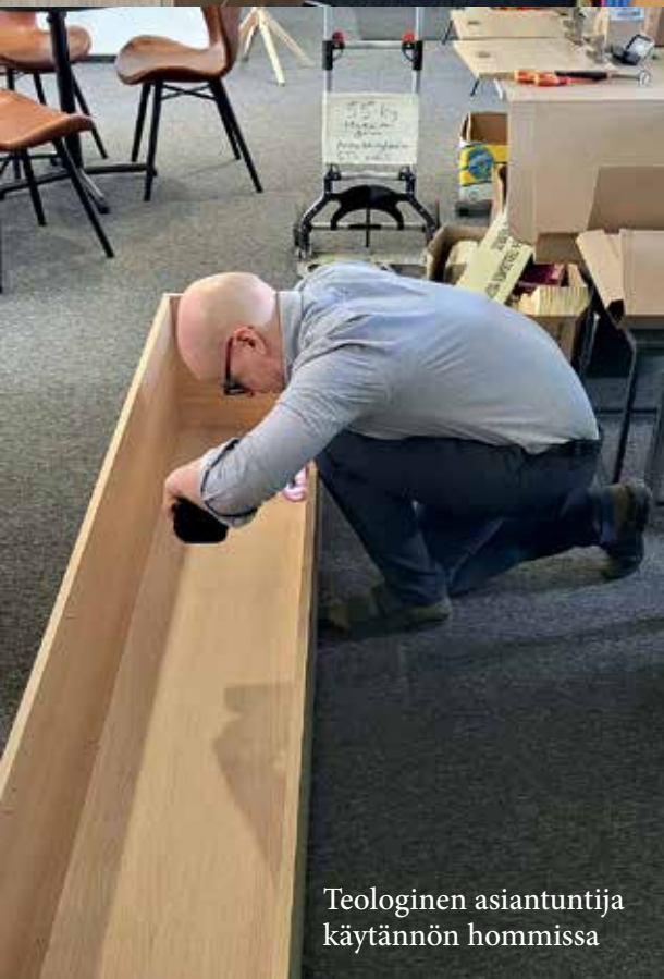
Teologinen asiantuntija käytännön hommissa