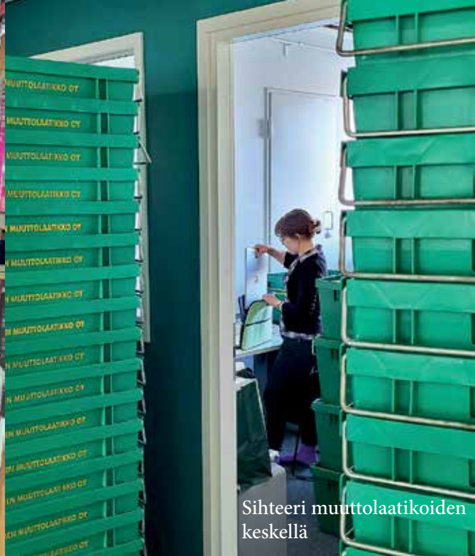
Sihteeri muuttolaatikoiden keskellä