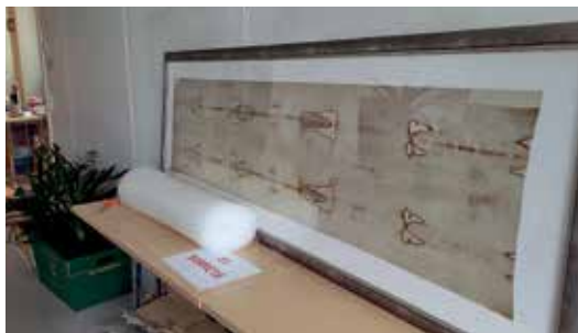
Tavlan packades från det gamla STI till den nya lokalen

Om Johannes står det att han ”såg och trodde”. Vad exakt var det som gjorde att Johannes trodde? Jag tänker mig att Johannes såg att kroppen lämnat svepeduken utan att höljet kommit i oordning.