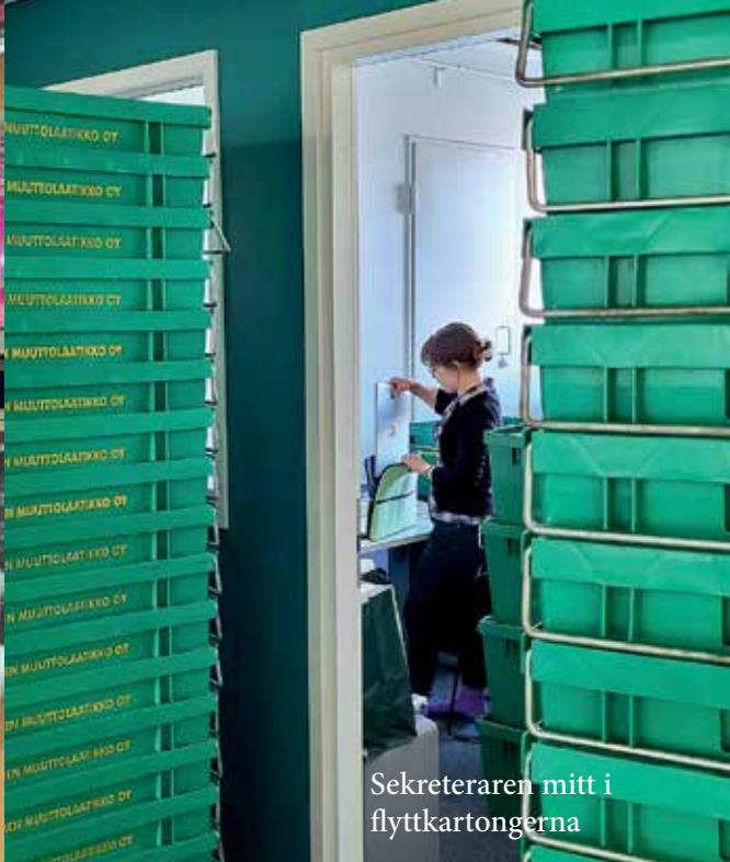
Sekreteraren mitt i flyttkartongerna