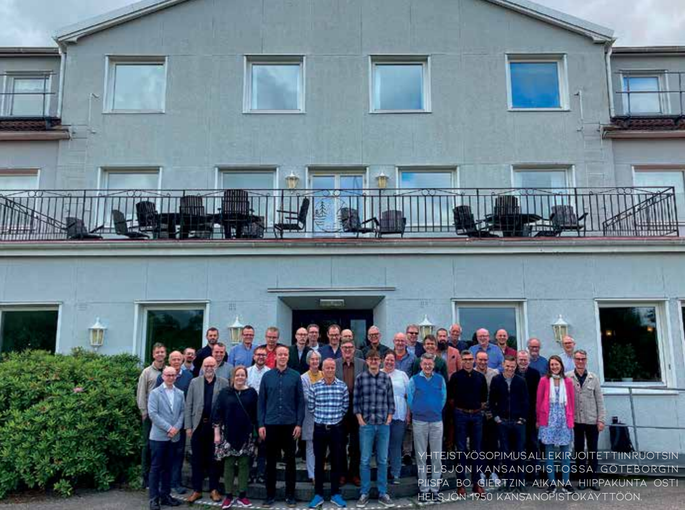
YHTEISTYÖSOPIMUSALLEKIRJOITETTINRUOTSIN HELJSJÖN KANSANOPISTOSSA. GÖTEBORGIN PIISPA BO GIERTZIN AIKANA HIIPPAKUNTA OSTI HELJSJÖN 1950 KANSANOPISTOKÄYTTÖÖN.

non suorittaneet voivat hakea normaalisti yliopistojen maisteriohjelmiin. FIUC:lla on jo norjankielinen maisteriohjelma, ja sen suunnitelmassa on tarjota jatkossa myös englanninkielinen maisteriohjelma.