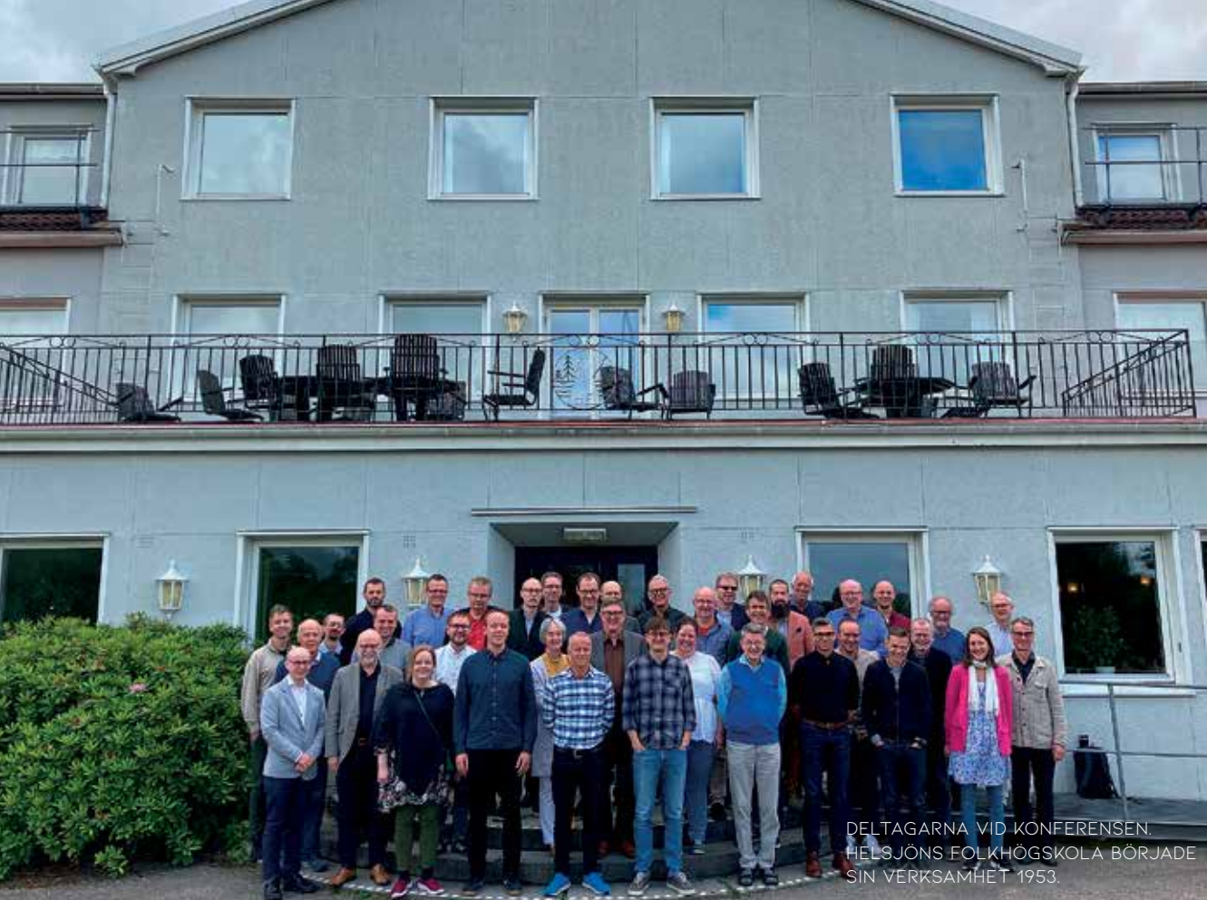
DELTAGARNA VID KONFERENSEN. HELSJÖNS FOLKHÖGSKOLA BÖRJADE SIN VERKSAMHET 1953.

STI:s lokaler. Studenterna kommer att kunna få studiestöd för sina studier och de som avlägger kandidatexamen kan sedan i vanlig ordning söka vidare till universitetens magisterprogram. FIUC har redan ett magisterprogram på norska och planerar att i framtiden även erbjuda ett magisterprogram på engelska.